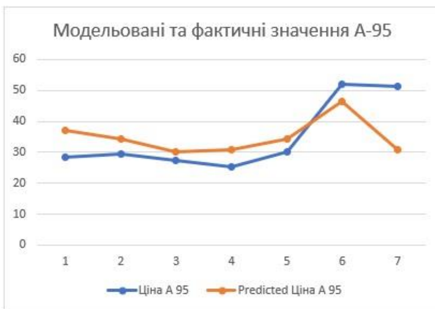
Рис. 3 Фактичні та модельовані значення А 95

На рис. 3 можна побачити графічне відображення модельованих та фактичних даних.