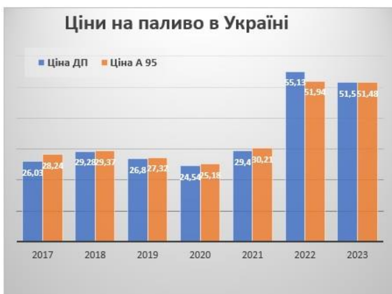
Рис. 1. Динаміка зміни цін на паливо

В означеному дослідженні пропонуємо розглядати два види палива, а саме: дизельне пальне та бензин А 95. [Жданюк Є. В. "Зв'язок між інфляцією та цінами на бензин."] На рис. 1 представлено динаміку росту цін на дані типи палива з 2017 року по 2023 рік.