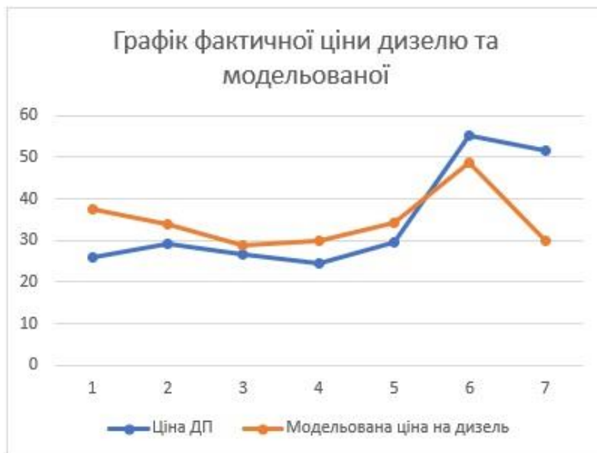
Рис. 2 Фактичні та модельовані ціни на дизель

На рис. 2 представлено графічне відображення фактичних та модельованих значень.